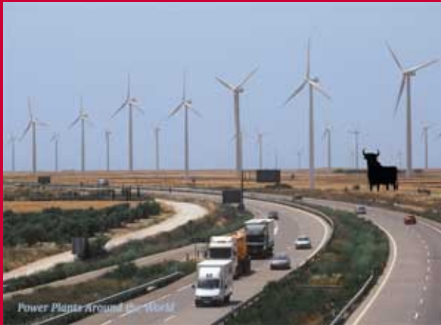
La bienvenida de los molinos de La Muela.

La Muela recibe cada año casi millón y medio de euros de la empresa que explota los 500 molinos de sus tierras. El año pasado, el viento del norte llevó a 240 vecinos de vacaciones a Brasil con dinero municipal.