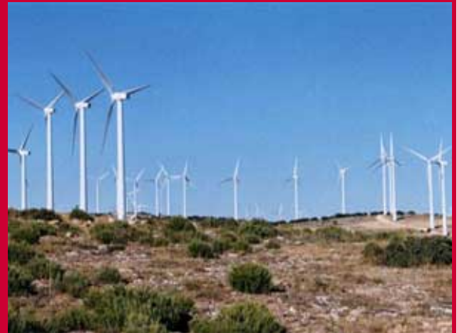
Las cinco instalaciones de Higuera de la Sierra, Albacete, conforman el parque eólico con mayor capacidad de España y uno de los más importantes de Europa.

El pueblo está 23 kilómetros al suroeste de Zaragoza en una región con serios problemas económicos. En 1986 se inauguró su primer parque eólico. Entonces se instalaron doce molinos, hoy hay 500. Hace 19 años eran 800 vecinos, hoy son casi 3.500.